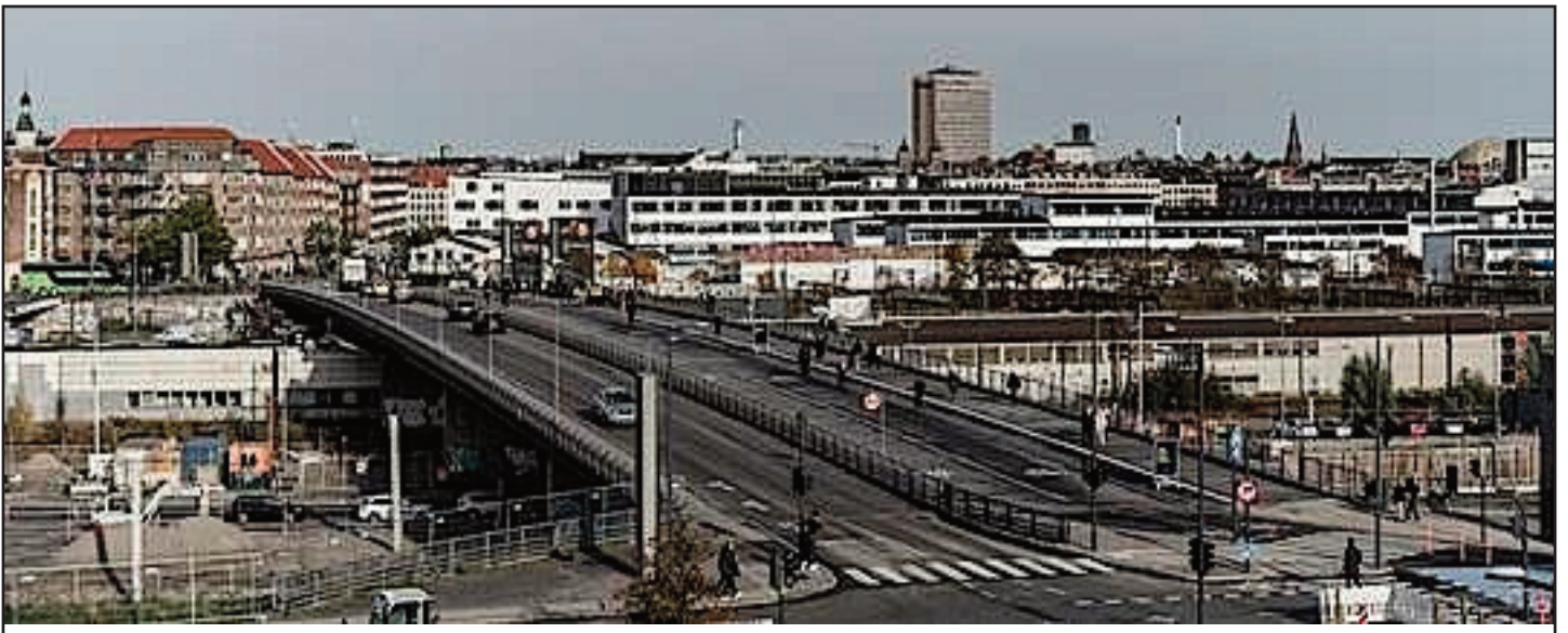
Dybbelsbro, som har Danmarks bredeste cykelsti, er endt i ren trafikchaos.

Rem Koolhaas(OMA) og bygherren er Realdania, der ligeledes har bekostet cykelbroen "Lille Langebro".