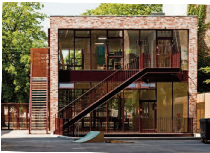
Bording Friskoles kreativitetshus tegnet af Dorte Mandrup.

Center for Kræft og Sundhed ligger i hjørnet af De gamles By over for Panum Institutet. Det fremstår med sine blanke aluminiumsfacader og spidstagede bygninger som en kontrast til de klassiske bygninger i røde mursten. Bygningskomplekset, der er tegnet af Nord Architects og indviet i 2011, er tænkt som en lille landsby af sammenhængende huse bygget omkring nogle indvendige, intime gårdrum. Center for Kræft & Sundhed er et samarbejde mellem Københavns Kommune og Kræftens Bekæmpelse. Centret tilbyder rehabilitering til borgere i Københavns Kommune, der har eller har haft kræft,